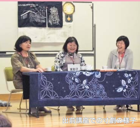
出前講座での寸劇の様子