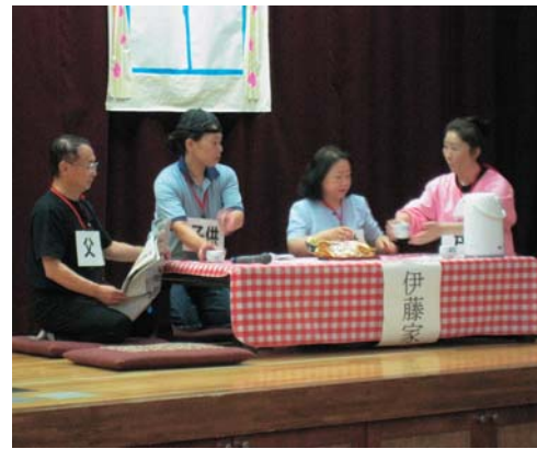
男女共同参画推進員による寸劇の様子

その後行われたグループワークでは、「幸せなこれからの過ごすために」をテーマに、参加者同士が意見を交換。それぞれの家庭の現状や、それぞれの立場での思い、地域の慣習など、多くの意見が出され