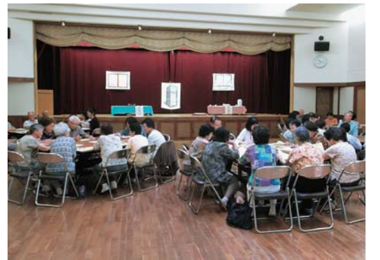
参加者41人が5つのグループに分かれ意見交換を行いました

るとともに、課題の解決方法などが話し合われました。参加者からは、「寸劇は分かりやすく良かった」「グループワークで皆さんの考えが聞けて良かった」「意外な発見があったとても楽しい時間でした」など、好評の声が聞かれました。推進員による趣向を凝らした説明で、より身近に感じられる男女共同参画。皆さんも学んでみませんか。