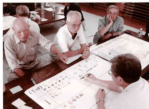
全員参加によるワークショップ。ほとんどの方が初めての体験でしたが、いろいろな課題への「気づき」があったようです。

こうして浮かびあがってきた地域の課題について、生活環境・教育・保健福祉・産業の4つの部会で構成される「地域づくり事業計画策定委員会」を組織し、解決に向けた取り組みをすすめています。そのほかにも、まちづくりリーダー養成講座による人材育成や独自のホームページ開設による情報発信など、地域住民に開かれた地域コミュニティとして活発な活動を展開しています。