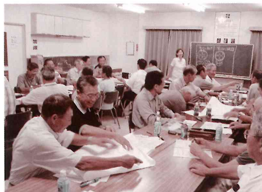
地域で活躍する人材を育成するため開催された「まちづくりリーダー養成講座」。

このうち、平成19年4月に設立された「湯口地区コミュニティ会議」では、8月から9月にかけて全世帯を対象とするアンケート調査を実施。また、行政区毎にワークショップを開催し、参加者一人ひとりの意見を大切にしながら、地域の課題を明らかにしてきました。