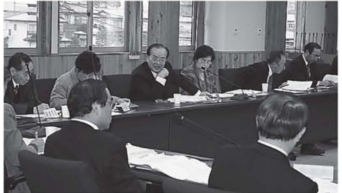
▲全体会による意見交換では、市民から寄せられる多くの意見が反映されています。