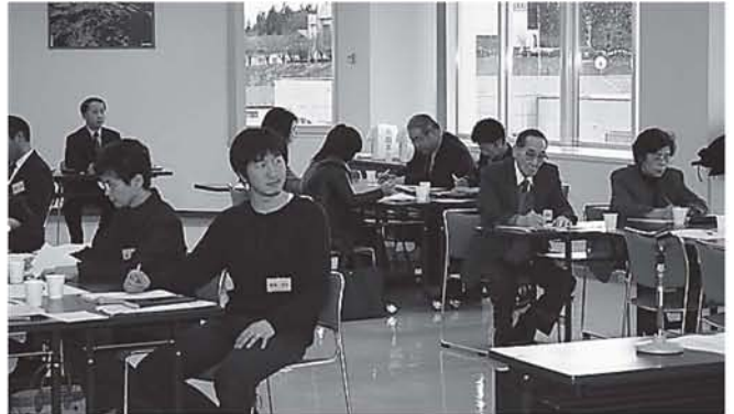
▲グループワークによる意見交換では「花巻らしい条例」「盛り込みたい項目」を検討しています。