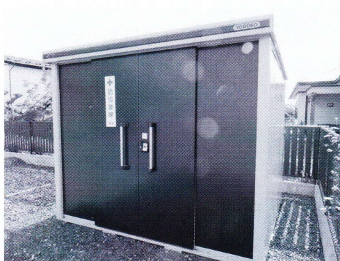
防災倉庫(南万丁目)