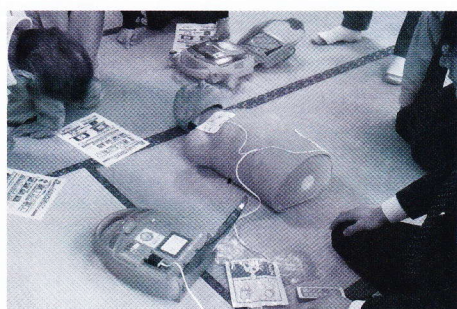
AED器機取扱い講習会