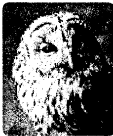
フクロウ (花巻市の鳥)