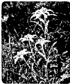
ハヤチネウスユキソウ (花巻市の花)