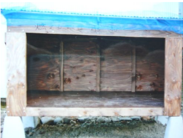
ごみ集積所設置、側溝整備