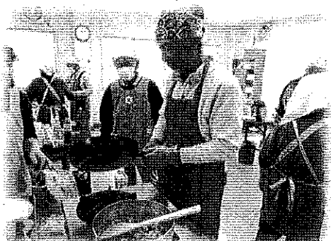
教室事業(男の料理教室)