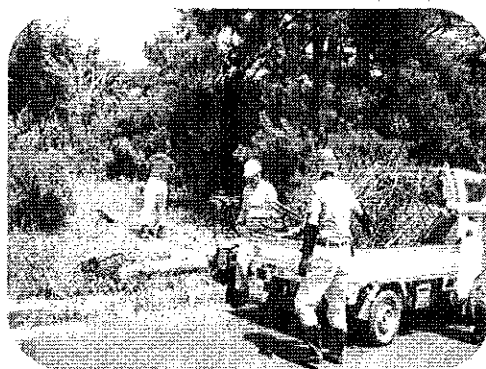
グラウンド環境整備専門委員会