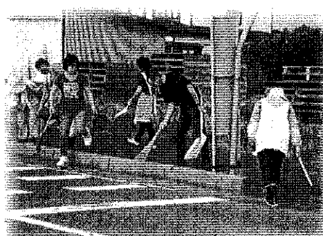
クリーン大作戦事業