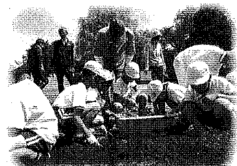
花いっぱい運動事業