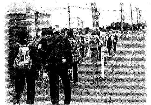
ウォークラリー事業