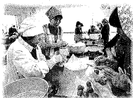
女性のつどい事業