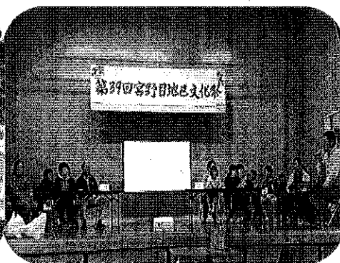
宮野目の歴史を学ぶ専門委員会