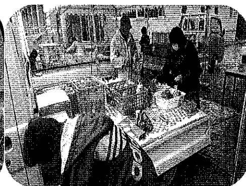
イベント専門委員会