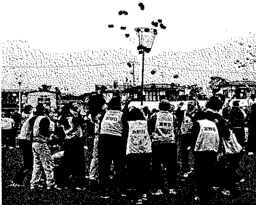
2015元気フェスティバル(紅白たま入れ)