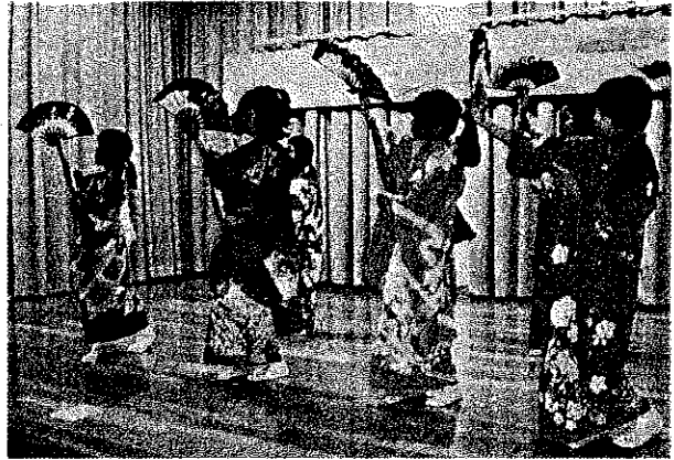
子ども踊り教室(伝承文化の継承)