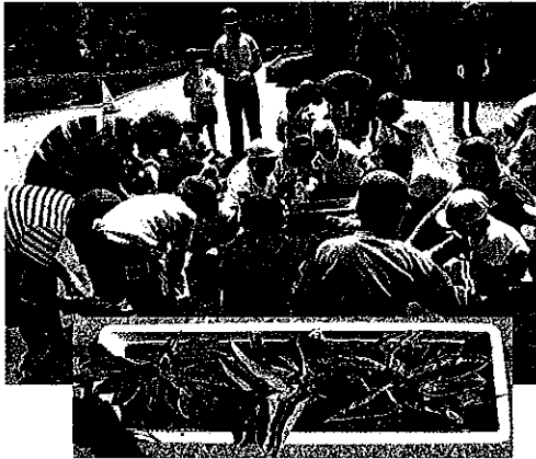
宮小「ハッピーロード」花植