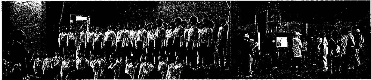
宮野目地区文化祭