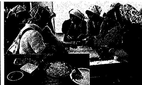
女性の集い(小麦まんじゅう・イチゴ大福など作り)