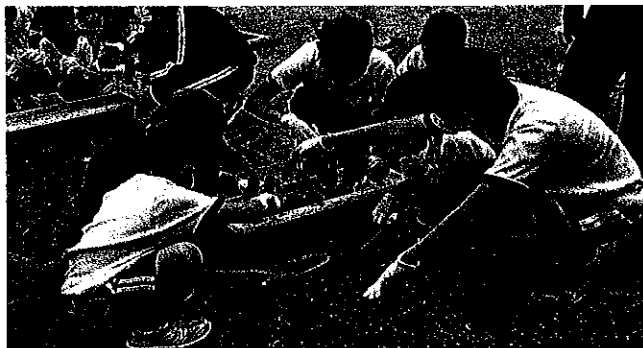
宮小「ハッピーロード」花植