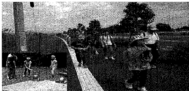
親子ウォークラリー