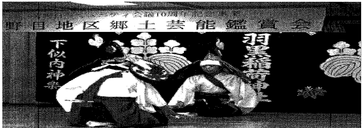
宮野目コミュニティ10周年記念事業 宮野目地区郷土芸能鑑賞会