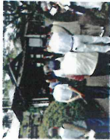
【高村光太郎ゆかりの地探訪 29.6.23 (金)】