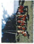
【役員視察研修 29.8.25(金)宮城県気 仙沼市唐桑町方面】