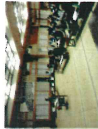
【太田の農業を考える会 30.2.24】