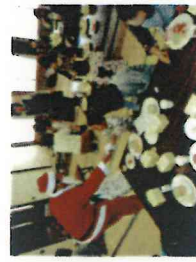
【子育てサロン 29.11.25 (土) 3回】