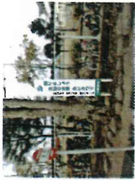
【三世交代 30.1.14(日)むらの家】