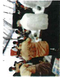
【釜石「かだっぺし」等農畜産物品交流 29.10.7】