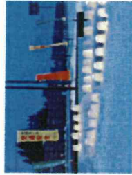
【「夢灯り」交通安全啓発 30.2.10～2.11】