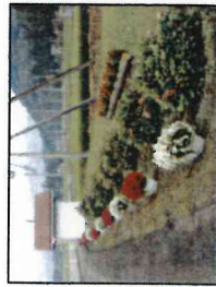
【花いっぱい運動 29.5月～11月】