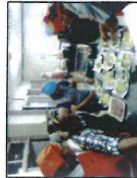
【食と健康推進 男の料理教室 29.9.8】