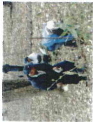
【カタクリ移植作業 29.4.29(土)】