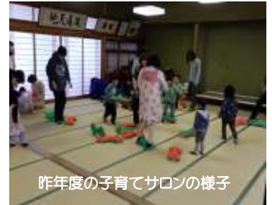
昨年度の子育てサロンの様子