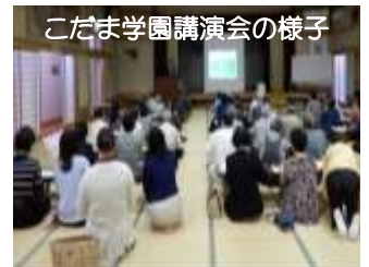
こだま学園講演会の様子