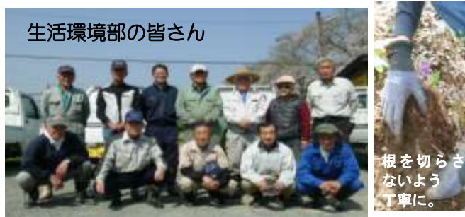
生活環境部の皆さん

少しずつ根付いてきたカタクリがきれいに咲くことを願い、部員の皆さんは丁寧に移植しました。