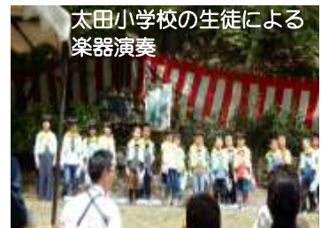
太田小学校の生徒による楽器演奏

山荘では、智恵子展望台をはじめ遊歩道もきれいに整備されました。これからの緑が美しい季節です。ぜひ訪れてみてください。