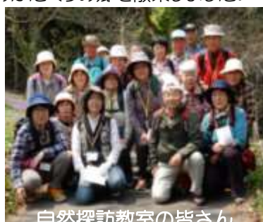
自然探訪教室の皆さん

かたくりの郷では、かたくりの群生に囲まれて昼食をとりました。笹間の受講生との交流もあり、有意義な時間となりました。