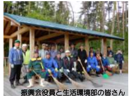
振興会役員と生活環境部の皆さん

5月12日(土)に山関、上太田地区の皆さんと太田地区振興会役員と生活環境部の部員が合同で智恵子展望台を中心とした山荘の清掃作業を致しました。早朝からの皆様のご協力ありがとうございました。