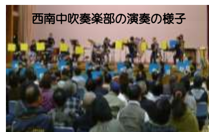
西南中吹奏楽部の演奏の様子