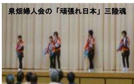
泉畑婦人会の「頑張れ日本」三陸魂