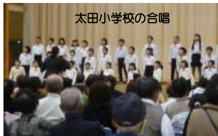
太田小学校の合唱