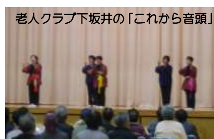
老人クラブ下坂井の「これから音頭」