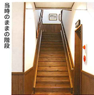
当時のままの階段

このほかにも大迫地域の物産紹介、観光案内、大迫のクラフト作品の紹介などを中心にご案内しています。