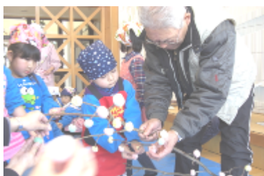
只今、団子付けのテクニックを習得中。