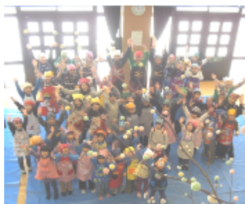
ついに完成、皆でバンザイ！

これらをミズキに飾り付け、立派なみずきだんごが完成。完成後は全員でもちの試食会を行いました。