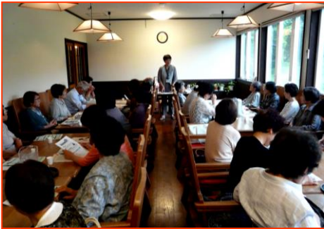
保健師長さんの講演