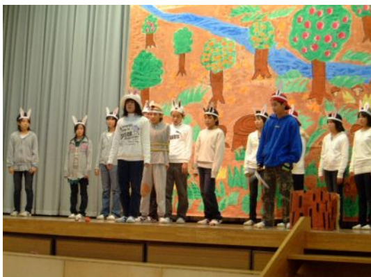
昨年の学習発表会より

さて今度は学習発表会に向けて、一生懸命練習に励んでいます。子ども達の成長の様子やがんばる姿を是非ご覧いただきたいと思っております。