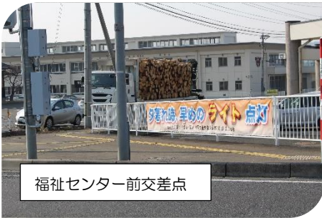
福祉センター前交差点

また、土沢地域づくり会議と交通安全協会土沢支部では、ドライバーに安全運転を呼びかける横断幕を設置しました。