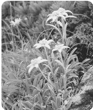
ハヤチネウスユキソウ