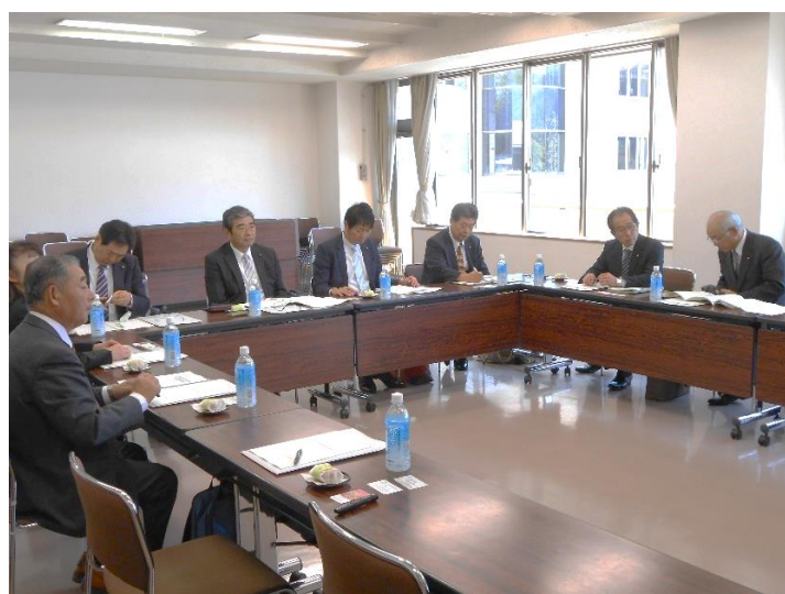
(行政視察 11/13 岐阜県郡上市)