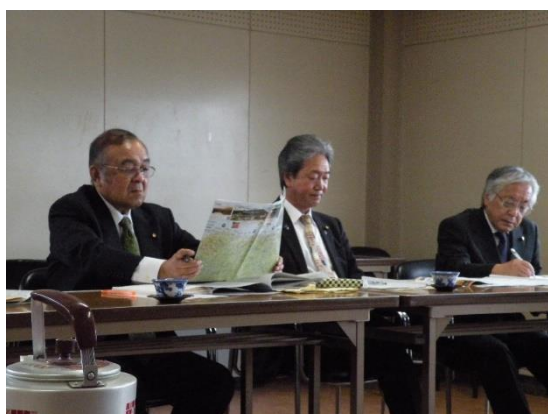
(行政視察 11/15 鳥取県境港市)