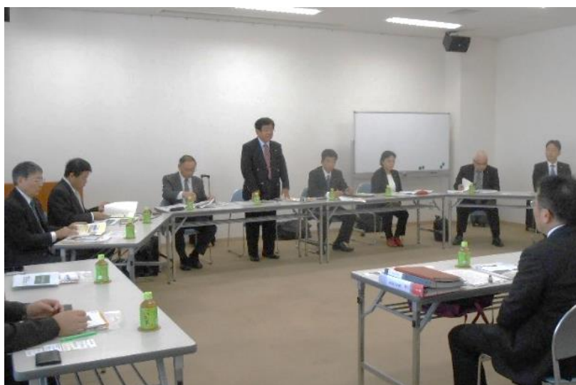
(行政視察 11/7 大阪府和泉市)