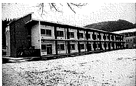
エアコン設置により学習環境が改善される (写真は大迫中学校)

12月定例会は11月30日から12月13日までの日程で開かれ、初日の本会議では、提出議案については、説明がなされたほか、市長による行政報告が行われました。 12月3日から5日までは、一般質問に14人が登壇し、市政について質問したほか、12月6日には議案審議が行われました。 提出された議案の中で、国の補正予算可決に伴う、交付金を活用した小中学校および公立幼稚園へのエアコン整備(設置)などを盛り込んだ平成30年度一般会計補正予算(第5号)や、東和コミュニティセンター新築(建築)工事の請負契約締結など17件を原案どおり可決しました。 一般会計補正予算の可決により、市内小中学校と幼稚園の計