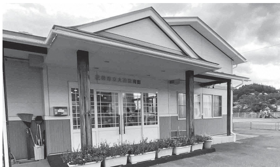
保育体制の強化が求められています