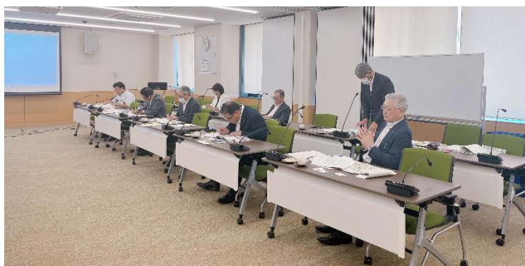
行政視察 福井県越前市（7月20日）