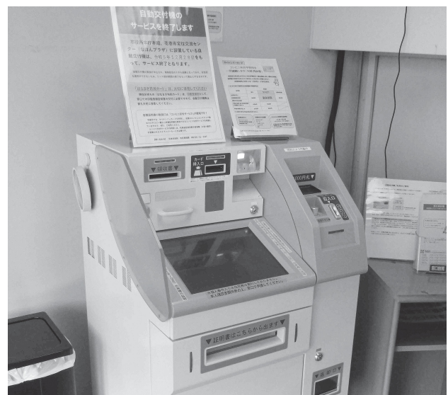
廃止となる証明書自動交付機