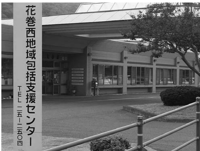
地域ケアの拠点としての機能が求められる地域包括支援センター

され内容も変わってきている。これらに対応するため、またサービス低下をさせないため、専門に担当する職員の採用が必要ではないか。 A(総務部長) 福祉専門職員の採用はしていないが、ケースワーカーなど資格が必要な分野は、有資格者を配置している。また、職員をフォローするため福祉分野の有資格者を非常勤職員に配置、各種相談業務に当たっている。