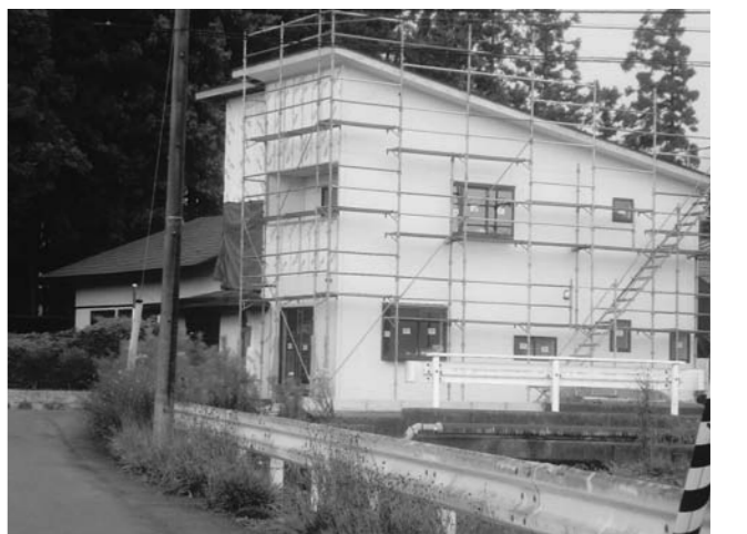
市民から好評だった住宅リフォーム事業

ラジオが配布される方の責務を伺う。なお、山崩れなどで陸の孤島となる恐れのある集落内で、災害弱者である高齢者世帯への配布をする考えがないか伺う。 A(総務部長) 緊急告知ラジオは防災の要となる自主防災組織の代表者、区長、民生委員等に優先的に貸与するもので、情報源として役立ててもらいたい。孤立化地域への配布については今後の課題としたい。