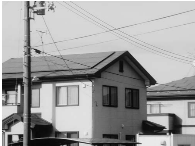
自然エネルギーへの転換が望まれる(太陽パネル設置住宅)

電動生ごみ処理機や堆肥化容器の購入補助制度があるが、思うように浸透していない。新たな減量策について見解を伺う。 A(生活福祉部長) 平成11年度以降、生ごみ処理機購入への補助等に取り組んでいるが、進まない状況である。今後、情報収集に努め、何が有効な策か検討し減量化に努めていく。