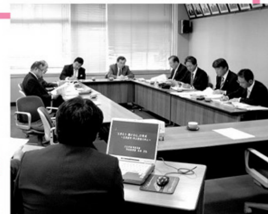
子どもの育成のため家庭・地域・小中幼保の連携 した取り組みについて説明を受けました(三田市)