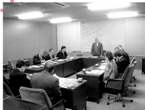
歴史や文化の魅力を活用した「まちなか歩き構想」 について説明を受けました(岐阜市)

視察日：平成21年11月11日～13日 視察先：滋賀県草津市、大津市 岐阜県岐阜市