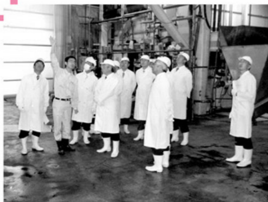
何重もの臭気対策が取られている飼料工場 (三幾飼料工業株式会社草加工場)

視察日：平成21年11月4日～5日 視察先：キリンビール株式会社仙台工場 三幾飼料工業株式会社草加工場