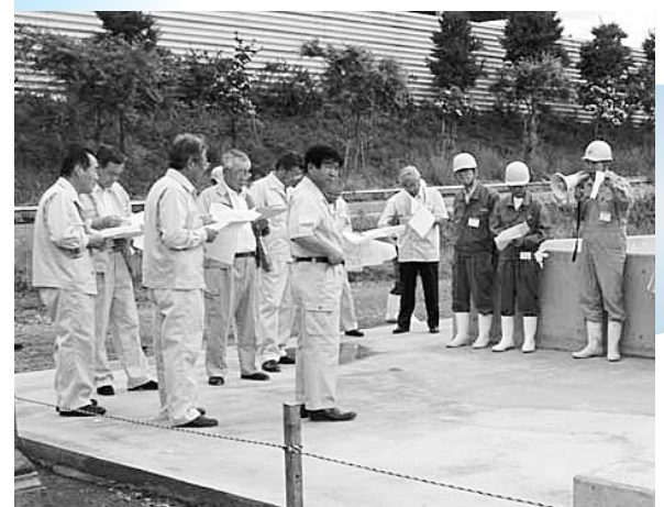
現地視察を行いました(太田油脂産業株式会社東北工場)

現地調査の実施、参考人の招致、太田油脂悪臭防止対策協議会および矢沢地域振興会との意見交換会など、22回の会議を開催し調査、検討に努めた。しかし、苦情件数は減少したものの、悪臭の発生は完全にはなくなっておらず、工場移転のめども立っていないなど、一定の責務と所期の目的の達成に至っていない状況であるとの結論に達した。よって、今回は、本委員会の設置以来、現在までの経過について中間というところで報告した。