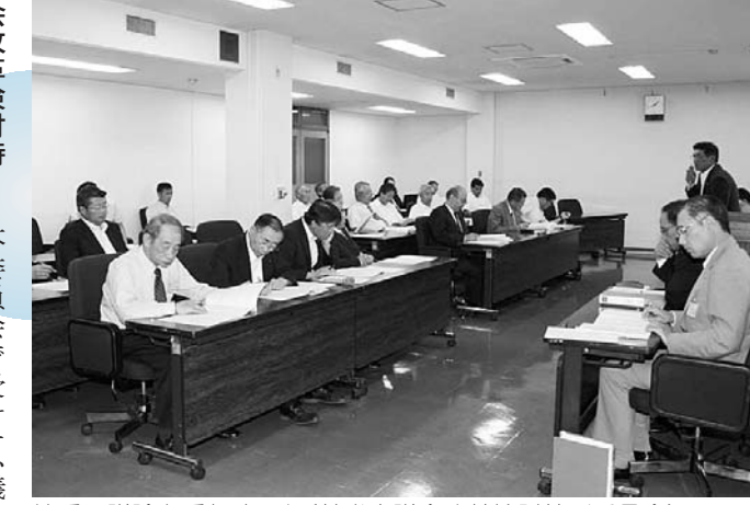
慎重に議論を重ねました(花巻市議会改革検討特別委員会)

花巻市議会改革検討特別委員会が花巻市議会基本条例について審査を終了したと報告を行いました。委員長報告は次のとおりです。 ●委員長報告(要約) 本委員会では、議会基本条例について検討する「議会基本条例検討小委員会」を設置し、そこで、300件を超える市民の皆さまのご意見や全国の事例等を参考に、34回にわたって協議を重ねた。そして、その経過の報告を