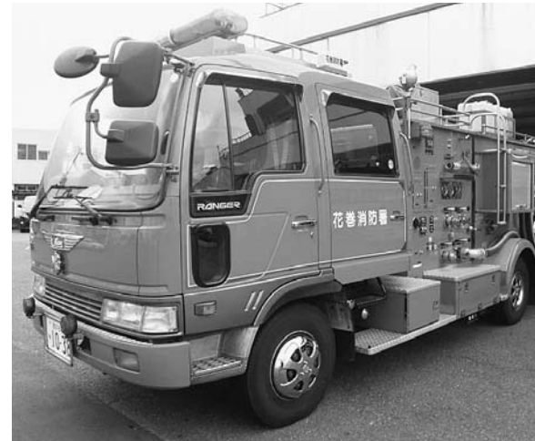
消防署本署の主力消防車として使用されている消防ポンプ自動車。16年間、市民の命と安全を守るため、日夜、出動しています