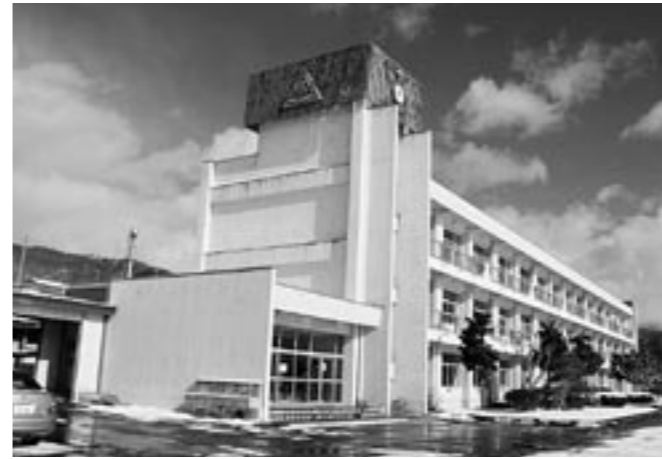
平成20年4月で創立60周年を迎えた大迫高等学校

たガイドラインを作成している。県でも平成20年に新型コロナウイルスガイドラインを策定している。本市としては、県と連携協力し、適切な情報提供、相談窓口の設置等を行うほか、発生時に対応する職員の感染防止のためマスクや保護衣の準備など流行レベルに応じた対策を講じるとともに、感染症予防対策連絡協議会で市独自のマニュアルを作成したい。