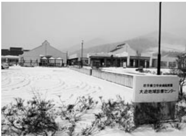
大迫地域診療センターは、大迫地区で唯一入院できる医療機関です

A (市長・教育部長) 生涯学習を地域づくりの環境と位置づけ、地域活動の中心となる人づくりにつながる事業を行うっており、これが大人の学びの力の向上に結びつくと考えている。社会教育については、生涯学習振興計画に基づき、拠点施設や各振興センターで事業を実施し、社会教育の推進を行う。指定管理者制度の導入は、施設の特異性から現時点では難しい。