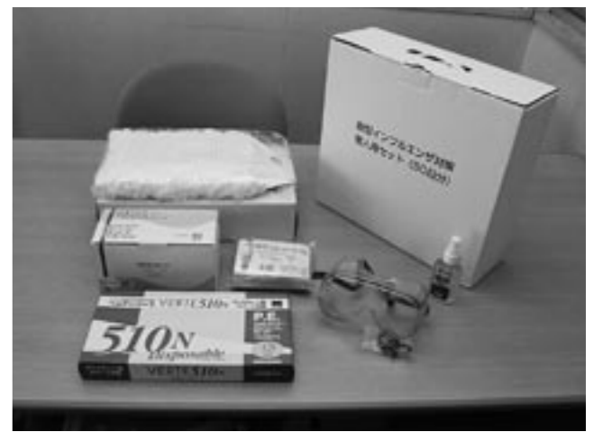
新型コロナウイルス対策として、マスク・ゴーグル・手袋・コート・消毒剤などが必要とされています

り組みを伺う。なお、進め方は地域のかたがたから具体的な顔づくりの絵を描かせ、5年程度のアクションプランを立て、官民協働で互いに責任を持って事業を遂行すべきと思うが見解を伺う。 A (市長) 各地区の中心市街地の閉塞状態を打開するきっかけづくりとしてスタートした。中心市街地の元気な地域づくり、まちづくりに結び付けていきたい。