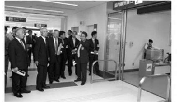
完成したターミナルビルの視察を行いました(4/16)

花巻空港対策特別委員会を終了とする委員長報告を可決しました。委員長報告(要約)は次のとおりです。 【委員長報告(要約)】 本委員会は、平成18年9月に、着手が延期されていた空港の新ターミナルビルをはじめとする整備事業の早期完成を目的として設置された。設置以降、整備事業の早期実現のために、経過概要の確認、現地調査の実施など調査・検討に努めてきた。そして、平成21年4