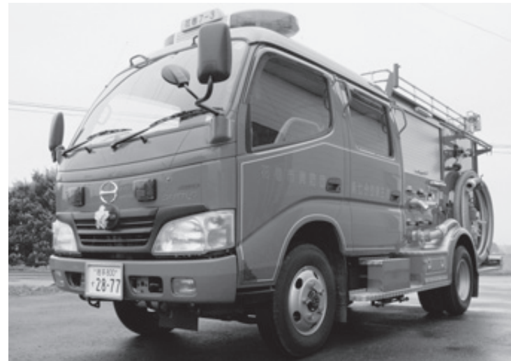
今年度取得するポンプ自動車は1分間に2000リットル以上の放水が可能です(第7分団第3部に配備されている同型のポンプ自動車)

消防団配備用消防ポンプ自動車の取得について、原案のとおり可決しました。 ポンプ自動車は花巻市消防団第3分団第6部花巻・柵ノ目、第10分団第1部1班大迫・外川目、第14分団第3部石鳥谷・西中島の各分団に配備されます。