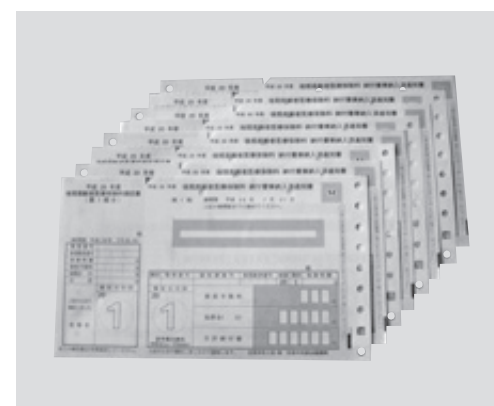
長寿医療制度(後期高齢者医療制度)の普通徴収納付書