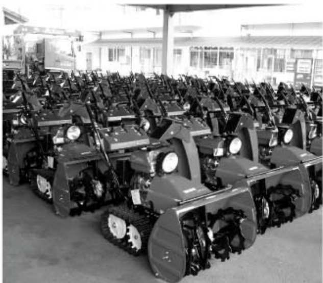
各地域での活用が期待される小型除雪機械