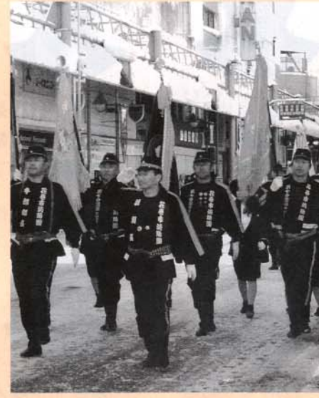
市民生活の安全を守る花巻消防団の出初式

総務部、政策企画部、生活環境部、総合防災部、総合支所（地域振興課、税務課、生活環境課に関する事項）、会計課、監査委員、選挙管理委員会、消防本部、消防署の所管に関する事項、他の常任委員会の所管に属さない事項