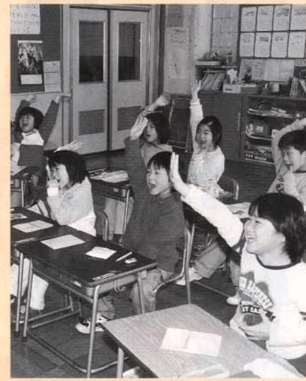
新市の未来を担う子どもたち(大迫小学校)