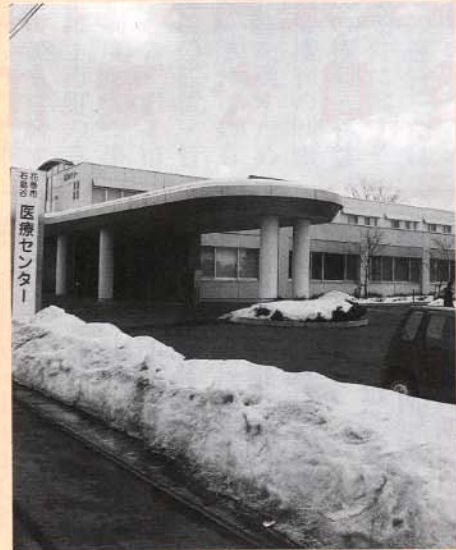
地域医療の拠点となる石鳥谷医療センター