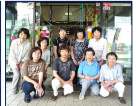
織り姫のみなさま