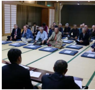
《昨年の懇談会の様子》

日時 10月18日(木) 午後6時30分から(1時間30分程度) 会場 花北振興センター 花北会館