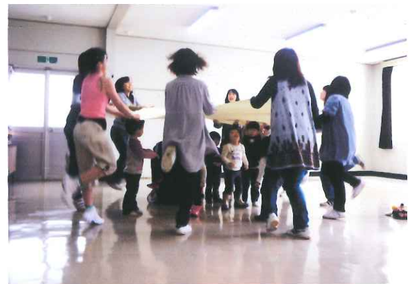
<親子体操の様子です>