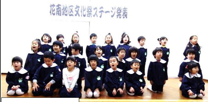
中央みのり幼稚園