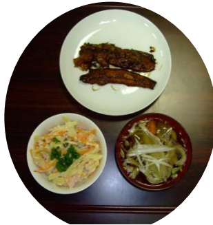
自慢の出来栄え 3品。家庭でおさらい忘れずに。