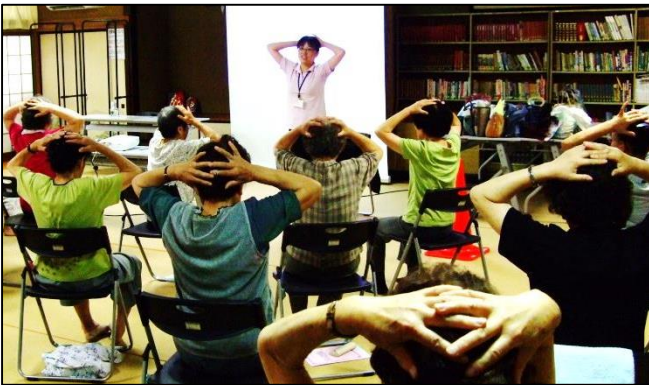
27 年度の花南高齢者・女性学級(合同開催)

振興センター(花巻市)主催の生涯学習事業は、これまで振興センターに勤務する市職員が担当していましたが、4月からコミュニティ会議で行います。高齢者学級や女性学級などの開催案内は、チラシ等でお知らせしますので、皆さんの参加をよろしくお願いします。