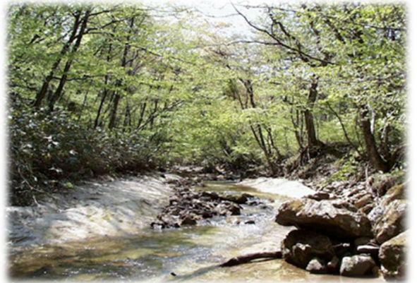
演習林内を流れる 赤沢川の清流(上)

★申込み者多数の場合は、今年度の自然観察会参加回数の少ない方から優先的に決定し、抽選を実施する場合は、同じ参加回数の方で抽選のうえ参加者を決定します。決定から漏れた方にのみ、16日(水)までにその旨を電話にて連絡します。電話連絡がない場合は参加決定です。