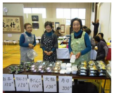
花南婦人会によるバザー