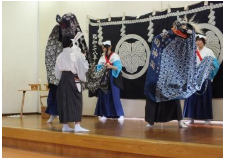
成田神楽スポーツ少年団による権現舞

作品展示部門へ出品、ステージ発表部門へ出演いただいた方々をはじめ、ご来場いただいたみなさま、準備・運営にご協力いただいた方々、実行委員のみなさま方に心より感謝申し上げます。