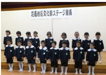
緊張するよ～（中央みのり幼稚園）