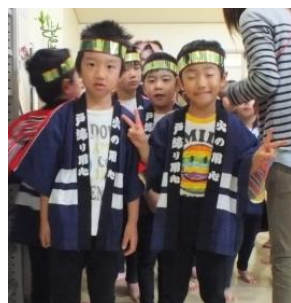
ピース！（南城保育園）