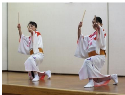
舞踊「無法松の一生」（琴の会）