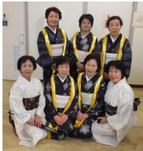
桜町一丁目親交会の姉さん方