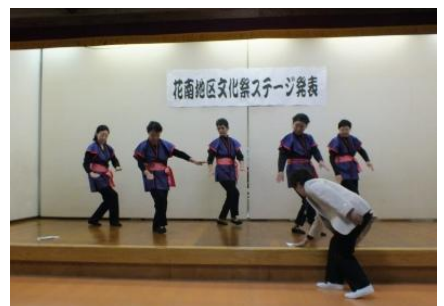
おおっ！！おひねりだ！！