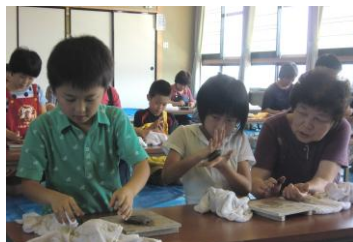
7月に開催した親子陶芸教室 どんな作品に焼き上がるかな？