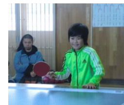
寒さも吹き飛ばして