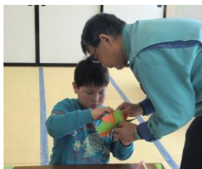
風車は羽根のつけ方が大事

1月7日(水)、「冬休みこども創作教室」を開催しました。25名の参加者は、花巻少年少女発明クラブの指導員による熱心な指導のもと、ふわふわと不思議な動きで空中を漂う植物のタネの模型や重ね風車を作りました。子どもたちは、思い思いに作品を飛ばしたり、風車を手にかけまわったりと、空気の不思議を存分に体験しました。