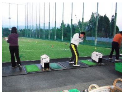
昨年度のゴルフ講座の様子