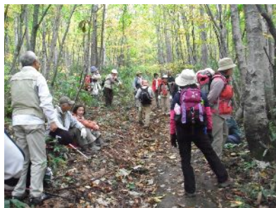
昨年度の山野草観察会の様子