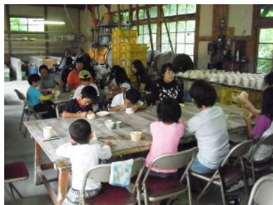
昨年の親子陶芸教室(絵付け体験)