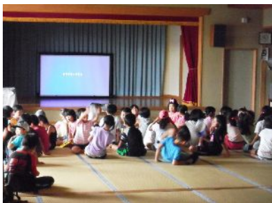
昨年の夏休み子ども映画会