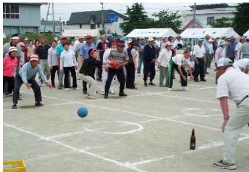
ボーリングリレー