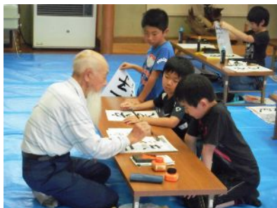
7月の書道教室の様子