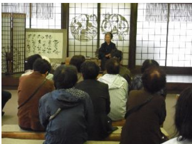
昨年の寿大学移動研修(遠野昔話村)