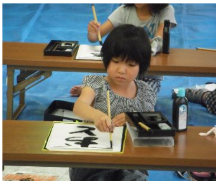
書道教室の様子 (10月の作品を文化祭へ出展)