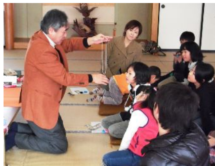
昨年の子ども手品教室の様子