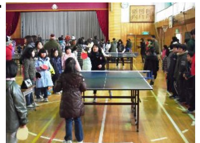
前回の大会の様子