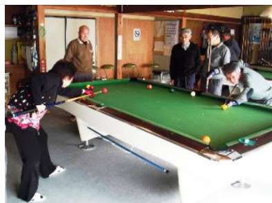
昨年のビリヤード講座