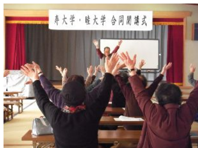
昨年の寿・睦大学閉講式記念講演