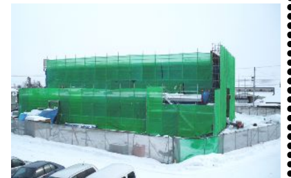
2月下旬の支店北側の様子

この工事に関するお問い合わせは、農協湯本支店(☎27-2326)へお願いします。