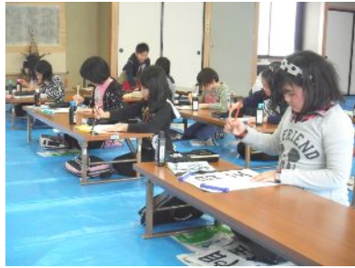
2月の書道教室の様子

受講希望の方は、湯本振興センターへ直接または電話等で申込みください。 (氏名・住所・電話番号、児童の場合は学年・組などもご連絡ください。)