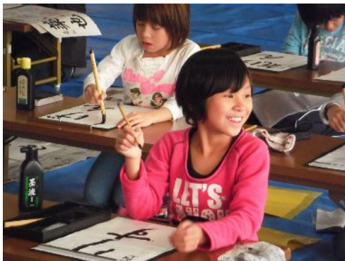
書道教室の様子 (10月の作品をゆもと文化祭へ出展)