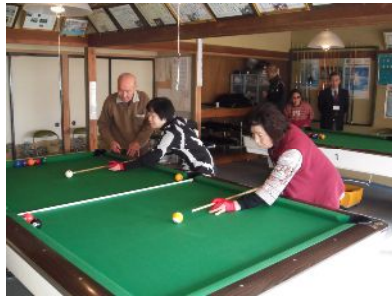
昨年のビリヤード講座