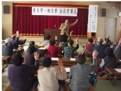
昨年の寿・睦大学閉講式記念講演